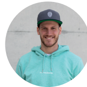
Leo Sales & Marketing