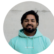
Doger IT, Foto & Video