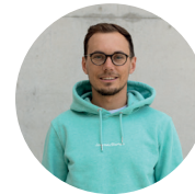
Philipp Business Development