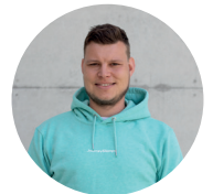
Nico App Development